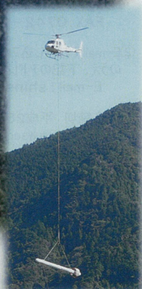
空中電磁波探査

平成24年7月にインドネシア国 アンボン島で発生した河道閉塞