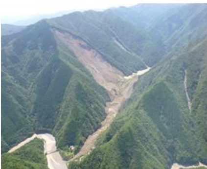
奈良県五條市大塔町赤谷地区に発生した河道閉塞（天然ダム）

現地研修には、次の 3 コースを予定しています。①深層崩壊コースとして奈良県五條市の赤谷の崩壊等を視察するコース、②地すべりと文化遺産コースとして奈良県と大阪府の境に存在する亀の瀬地すべり等を視察するコース、③文化・観光コースとして随伴者等を対象として奈良市内の史跡を巡るコース。