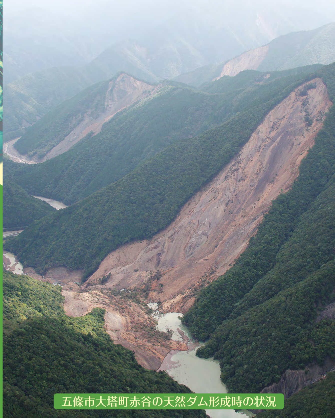
五條市大塔町赤谷の天然ダム形成時の状況

主催:インタープリバント2014実行委員会、環太平洋インタープリバント協議会 共催:International Research Society INTERPRAEVENT、(公社)砂防学会 後援:国土交通省、奈良県 協賛:(一社)国際砂防協会、(一社)全国治水砂防協会、(一財)砂防・地すべり技術センター、(一財)砂防フロンティア整備推進機構