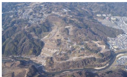
亀の瀬地すべり地区