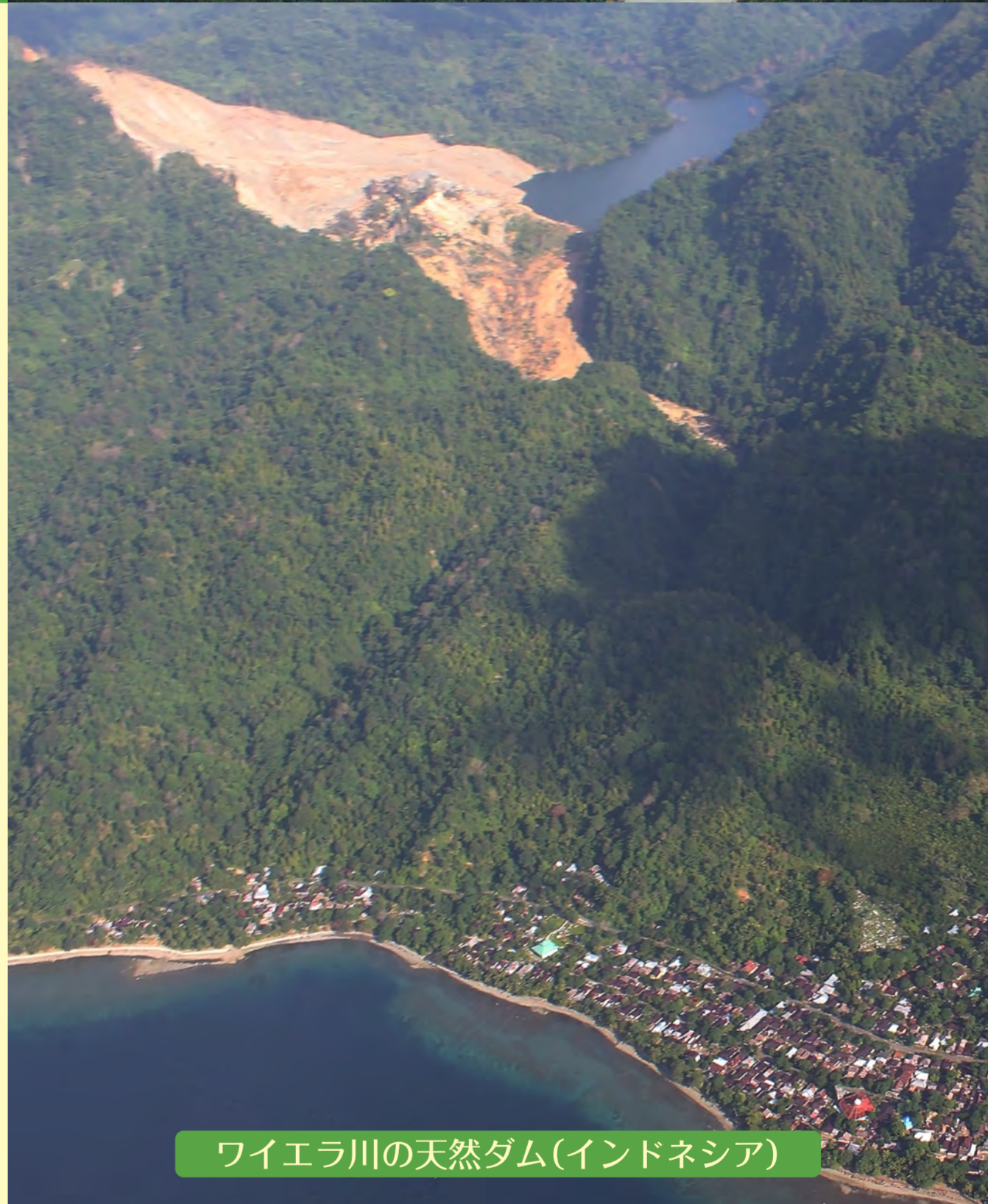
ワイエラ川の天然ダム(インドネシア)