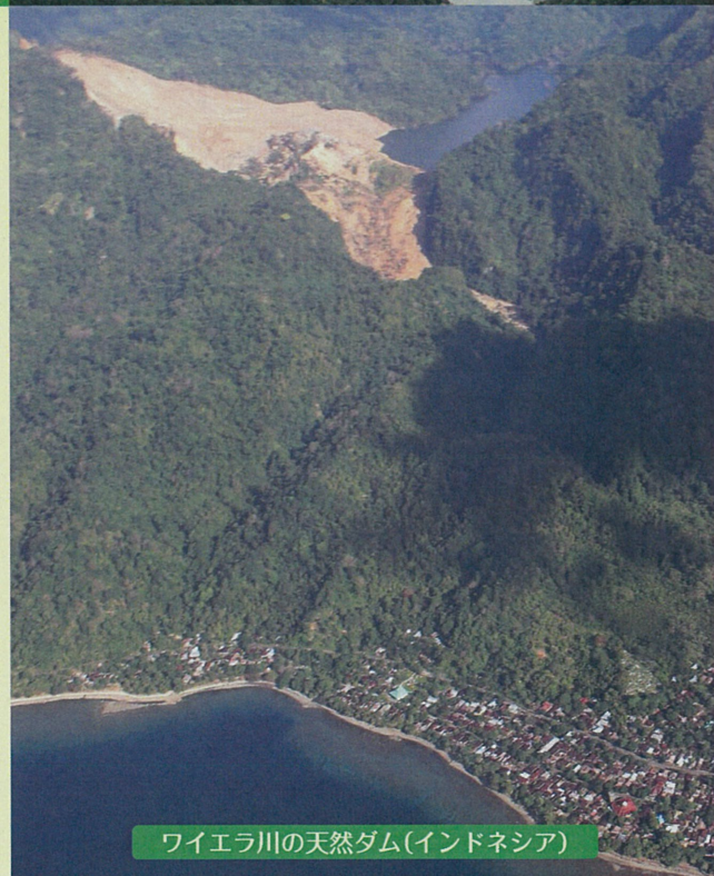
ワイエラ川の天然ダム(インドネシア)