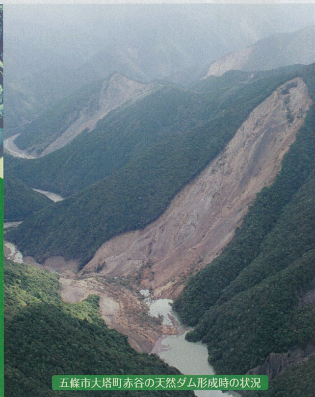
五條市大塔町赤谷の天然ダム形成時の状況

主催:インタープリバント2014実行委員会、環太平洋インタープリバント協議会 共催:International Research Society INTERPRAEVENT、(公社)砂防学会 後援:国土交通省、奈良県 協賛:(一社)国際砂防協会、(一社)全国治水砂防協会、(一財)砂防・地すべり技術センター、(一財)砂防フロンティア整備推進機構