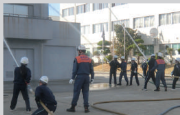
消防学校体験入校での放水訓練