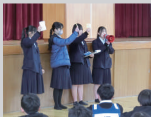
小中学校に向向いて、防災に関する特別授業を実施

全国初の防災専門学科として、2002年4月に開設されました。阪神・淡路大震災の教訓を受け継ぎ、全国の被災地支援や地域の防災訓練への参加、小学校での出前講座などのボランティア活動に取組み、防災教育の推進に取り組んでいます。