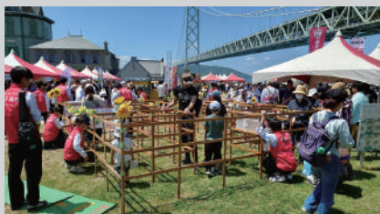
たるみっこまつり(県立舞子公園)にて、「ひまわり楽習迷路」の出店