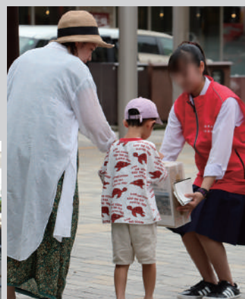
被災地支援のための募金活動